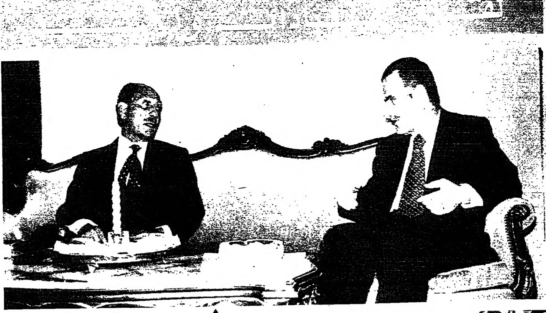
القضاء الاول بين الرئيسين قبل بدء المحادثات الرسمية